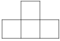
Pyramide à 2 étages

On veut construire une suite de pyramides.