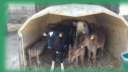
Photo réalisée par les élèves de Seconde du lycée de Venours dans le cadre de l'activité de photolangage

L'inscription de l'agroécologie dans la loi d'avenir pour l'agriculture (2014) sous-tend un renouvellement des façons de concevoir et gérer des systèmes de productions agricoles. Si les systèmes agricoles intensifs et consommateurs d'intrants sont remis en cause, il n'existe pas pour autant de modèle unique sur lequel prendre appui. Le plan « Enseigner à produire autrement » du ministère de l'agriculture place la formation comme levier de changement central afin de doter de capacités et de comportements les acteurs de demain pour qu'ils relèvent les défis en déclinant concrètement l'agroécologie à partir de projets d'innovation. S'engager dans l'agroécologie exige des changements à tous les niveaux du système sociotechnique et des évolutions dans les pratiques et les raisonnements. Cette transition agroécologique peut être considérée comme une Question Socialement Vive (QSV) car les réajustements continus nécessaires à sa mise en place sont porteurs d'incertitudes, voire de controverses, dans les débats entre scientifiques, entre professionnels et plus globalement dans la société.