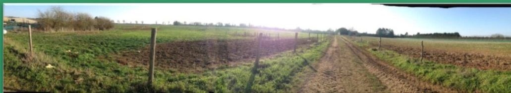
Photo réalisée par les élèves de Seconde du lycée de Venours dans le cadre de l'activité de Photolangage

L'inscription de l'agroécologie dans la loi d'avenir pour l'agriculture (2014) sous-tend un renouvellement des façons de concevoir et gérer des systèmes de productions agricoles. Si les systèmes agricoles intensifs et consommateurs d'intrants sont remis en cause, il n'existe pas pour autant de modèle unique sur lequel prendre appui. Le plan « Enseigner à produire autrement » du ministère de l'agriculture place la formation comme levier de changement central afin de doter de capacités et de comportements les acteurs de demain pour qu'ils relèvent les défis en déclinant concrètement l'agroécologie à partir de projets d'innovation. S'engager dans l'agroécologie exige des changements à tous les niveaux du système sociotechnique et des évolutions dans les pratiques et les raisonnements. Cette transition agroécologique peut être considérée comme une Question Socialement Vive (QSV) car les réajustements continus nécessaires à sa mise en place sont porteurs d'incertitudes, voire de controverses, dans les débats entre scientifiques, entre professionnels et plus globalement dans la société.