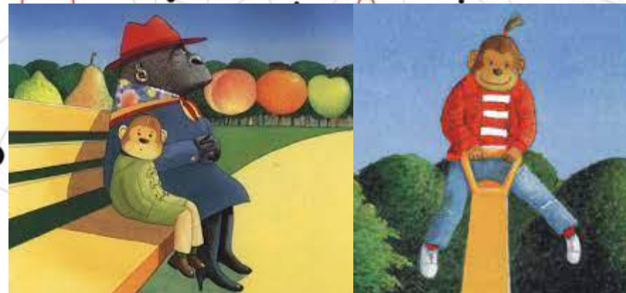
Aline Fablet & Pascale Gacem PE 1 er degré - PRCE 2 nd degré