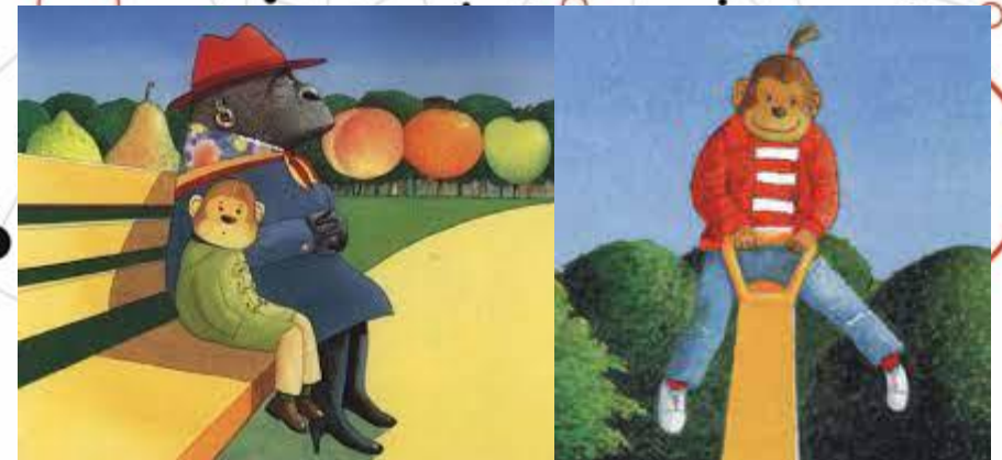
Aline Fablet & Pascale Gacem PE 1 er degré - PRCE 2 nd degré