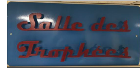
Plaque réalisée par les CAP RIC 2019-2020