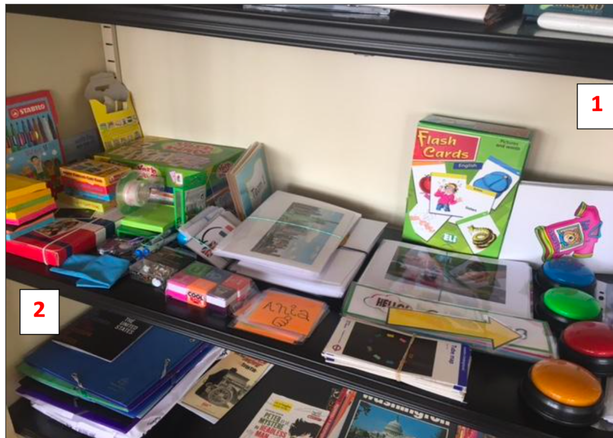
4 | Expérimentation CAPture – « Trousse à outils » enseignant – ressource LÉA CAPture, proposée par I.Balli et élaborée avec F.Michel, correspondant LÉA