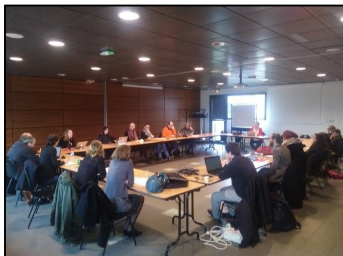
Réflexion du LÉA sur l'évaluation (lycée Beaupré, Haubourdin, 2018)

Des temps de réflexion collective entre professeurs sur le protocole de recherche en classe, le traitement des données recueillies, les apports didactiques et pédagogiques de la démarche ou l'évaluation des travaux d'élèves permettent de produire des récits d'expérience critiques, mis en ligne sur le site de l'IFE. Ces récits sont présentés en formation continue auprès des collègues de l'académie de Lille. Une web radio et une veille scientifique sur Twitter sont mises à leur disposition.