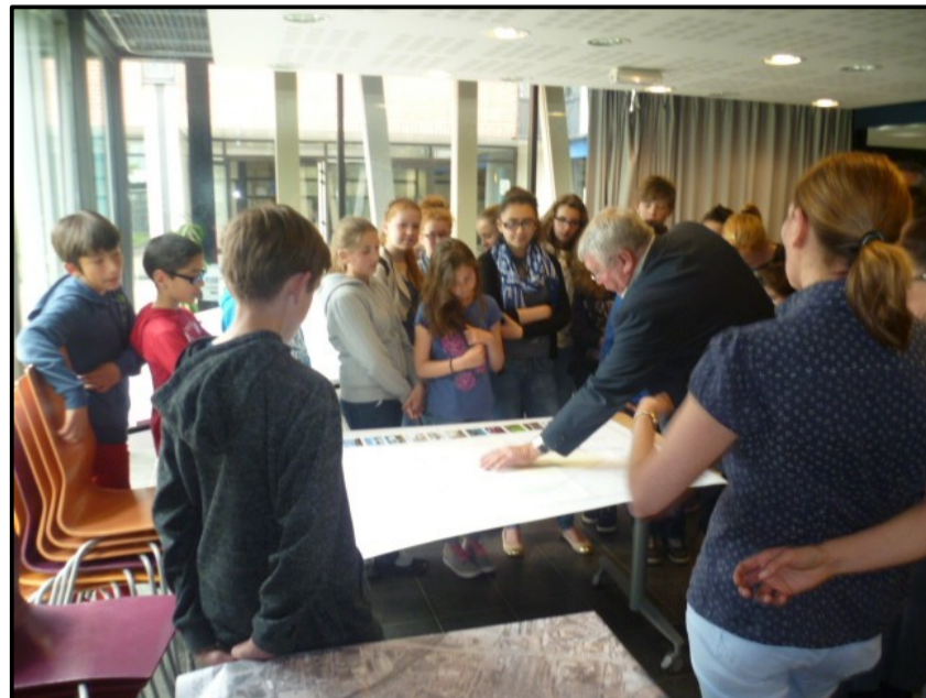
Rencontre d'une classe de 6 e avec le maire de Marquette-lez-Lille, 2018