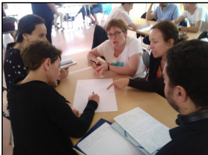
Travail en atelier sur la notion de controverse (lycée Darchicourt, Hénin-Beaumont, 2018)