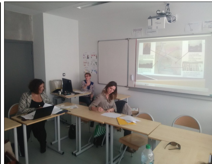
Le LÉA forme des collègues dans le cadre du PAF (collège Nina Simone, Lille, 2017)