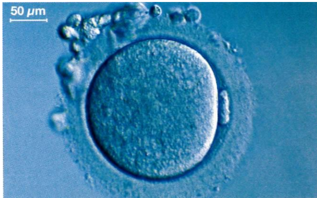
Ovule humain observé au microscope optique (SVT 4 e . Didier 2007)