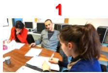
1 Tutorat stagiaire Formation initiale Entrée disciplinaire