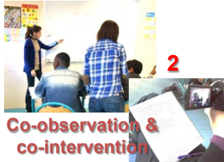
2 Co-observation & co-intervention Entrée informelle