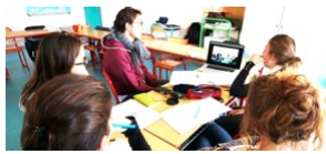
6 Enquête collaborative Entrée analyse de l'activité / thème professionnel