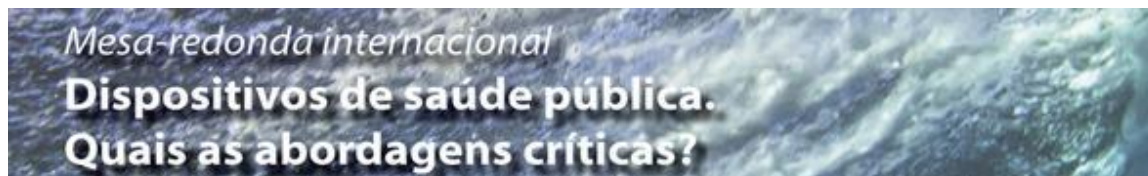
Table ronde sur éducation à la santé

L'éducation à la santé, les réaménagements urbains, l'intervention de l'Etat sur la qualité des aliments disponibles, la mise en place de nudges, etc. - tous ces dispositifs sont traversés par des tensions qui sont communes dans le champ de la santé publique. Les sciences humaines et sociales, en Europe et en Amérique du Nord et du Sud, contribuent à la fois à la construction et à la critique de ces dispositifs. Cette table-ronde organisée depuis São Paulo vise à faire le point sur les regards critiques en santé publique, suivant une approche internationale et interdisciplinaire.